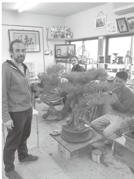
研修生 フランス、スペイン、中国

それに加え、最近海外からの問い合わせが多いのが、日本に来て盆栽を学びたいと言う人の増加です。私の盆栽園でも2年ほど前から可能な限り受け入れを行ってきました。