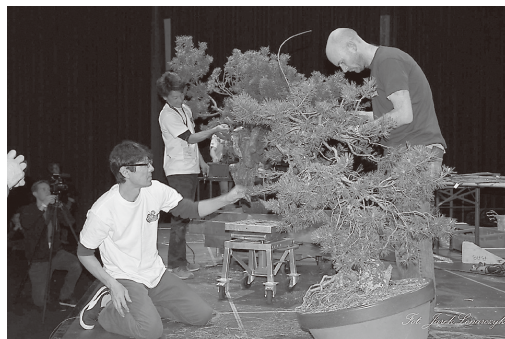
ベルギー、デモンストレーション風景

海外の大会で日本と違うイベントとして、デモンストレーションという催しがあります。これは、ステージの上で実際に観客に盆栽の手入れを見せるもので外国人らしい発想の催しです。観客を楽しませるといふ海外の方々特有の発想であり、お客様を楽しませるといふ発想のなかった日本の盆栽界が最も見習い、反省するところだと感じます。